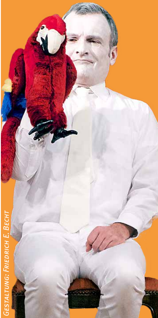
GESTALTUNG: FRIEDRICH E. BECHT

Theater, Kabarett, Kindertheater, Jugendtheater Kleinkunst, Konzerte, Lesungen, Vorträge